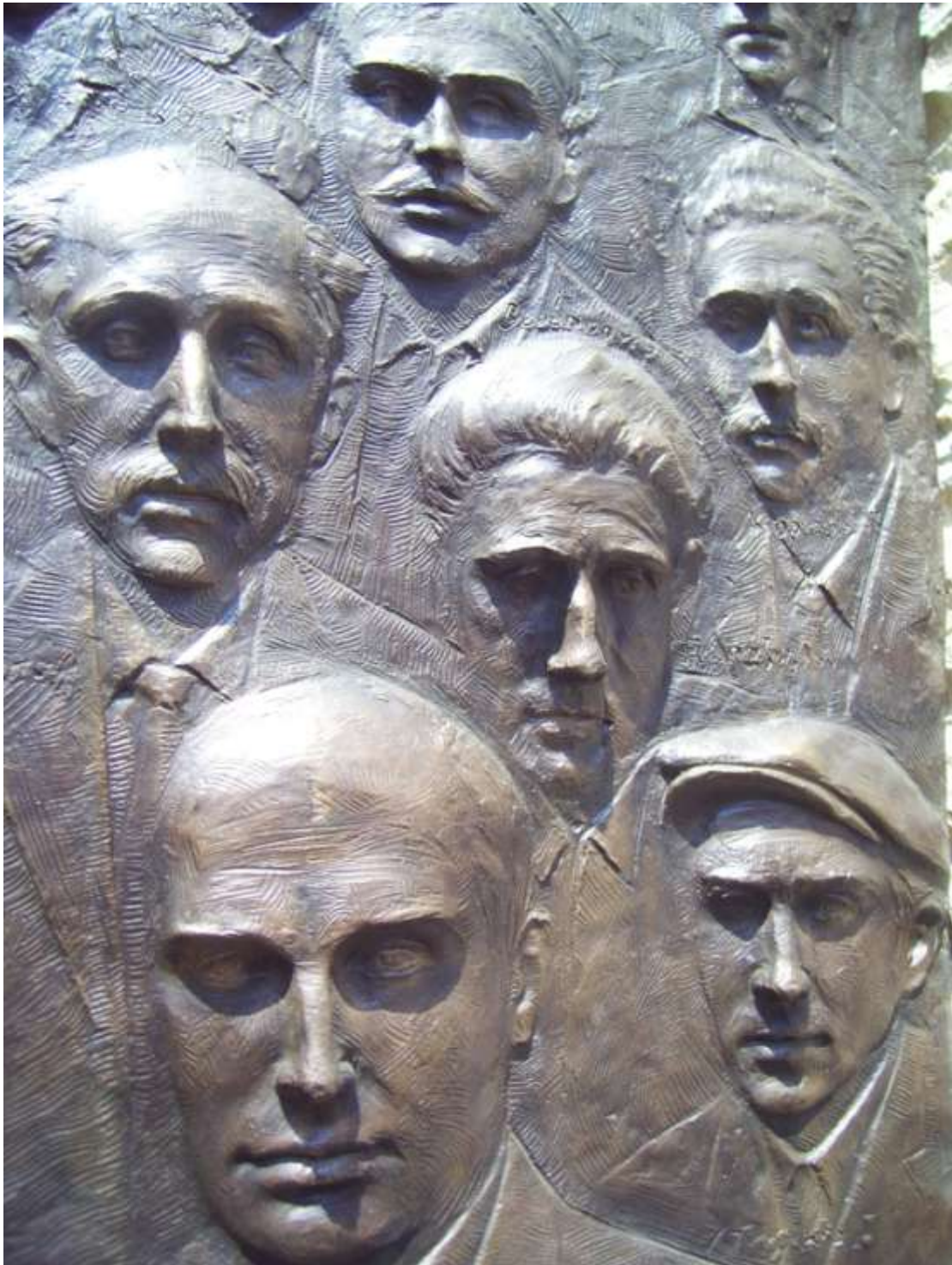
Λεπτομέρεια από το μνημείο για την εκτέλεση των 200 πατριωτών την Πρωτομαγιά του 1944 στο Σκοπευτήριο της Καισαριανής.