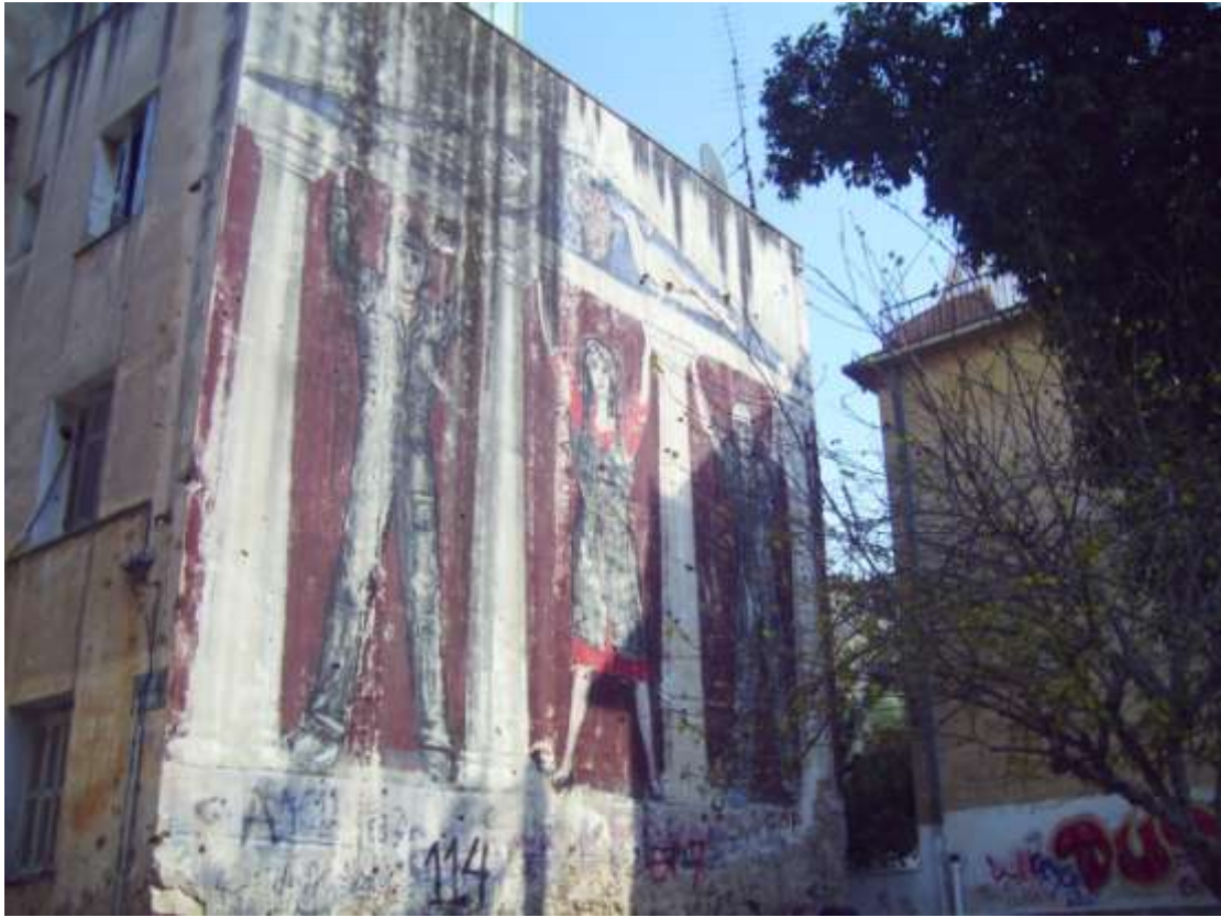
Τοιχογραφία στις προσφυγικές πολυκατοικίες της Καισαριανής. Διακρίνονται ίχνη από τις μάχες που έγιναν κατά τη διάρκεια του Δεκέμβρη του 1944