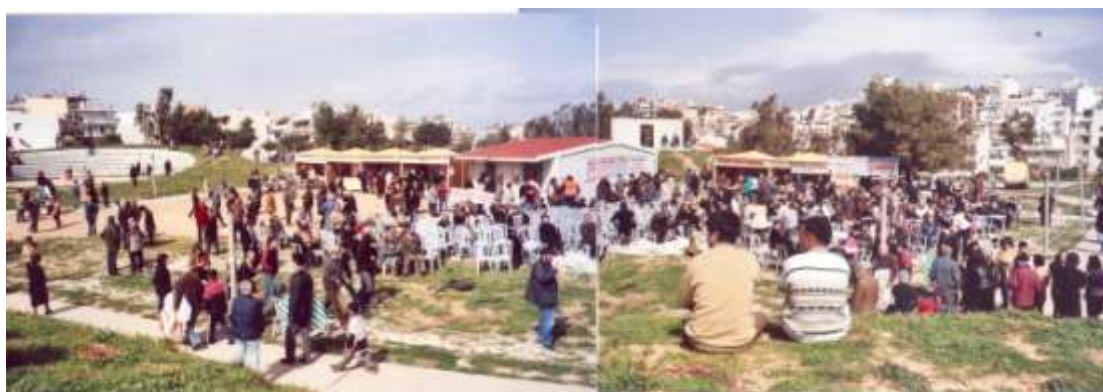
Η περιοχή του πρώην λατομείου Χαλικάκη, Καθαρή Δευτέρα 2006.