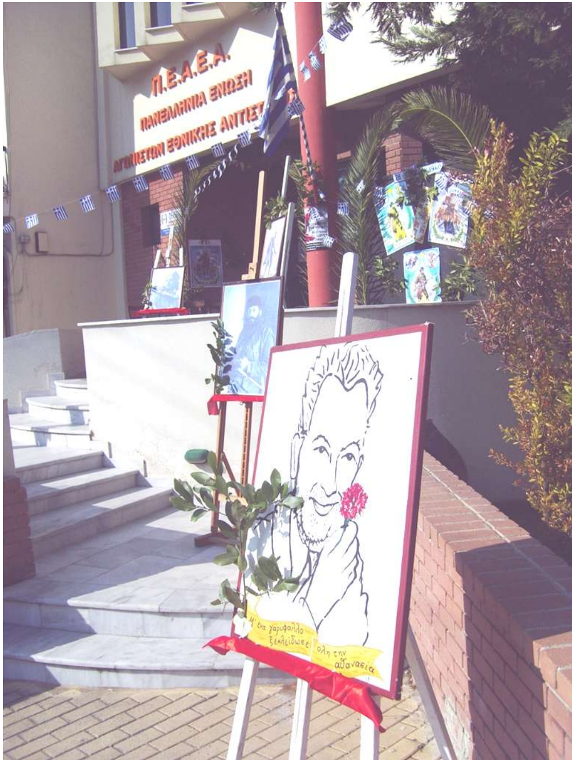
Ηλιούπολη, Μουσείο Εθνικής Αντίστασης, εκδήλωση της Π.Ε. Α.Ε.Α